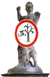
Hřiště u zámku KOUNICE